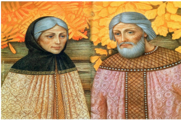
Святые Петр и Феврония. Художник: Александр Простев

Всё началось с наших праотцев — Адама и Евы. Они получили в раю заповедь: не вкушать от древа познания добра и зла (см.: Быт. 2: 17). Заповедь «не вкушать того-то и того» прекрасно знакома любому православному человеку. Это заповедь о посте — самый древний росток семейной аскезы.